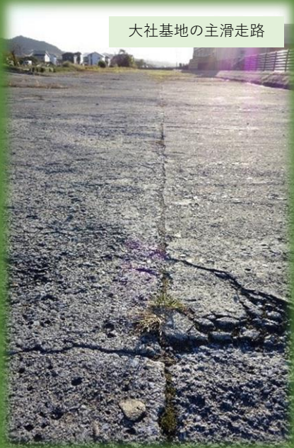
大社基地の主滑走路