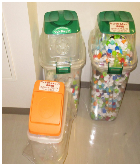
A・B病棟2階看護師控室前集積場所