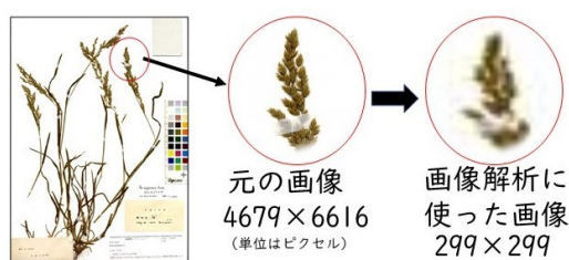
図 7. 学習に用いた画像は 299×299ピクセルであり、もとの画像とくらべると粗いです。

このような画像を用いても AI は種の判定を行うことができました。一方で人間は細かい部位の形態を時には虫眼鏡を使って観察し種を判定することもあります。