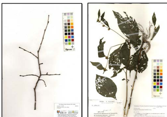
図 5. 標本の中には葉が取れてしまっていないものや、葉に虫食いの穴が沢山空いているものがあります。このような標本約 3 万点を学習対象から外すことで判定成功率が上昇しました。

57万枚の標本画像を収集し、それらを AI 画像認識システムを用いて学習させ、種名を判定するシステムを構築しました。対象となるのは約 2000 種であり、96.4%と極めて高い判定精度で正しい種名を選び出すことができます。こういった標本画像が判定に向かないか(図 5)、専門家がよく間違える種を AI も同じく間違えている事などもわかりました(図 6)。学習に用いた画像ファイルの解像度は低く、細かい部位までは見えませんが、AI は正しく判定できていることがわかりました(図 7)。AI が判定に使った部位を可視化することができる Grad-CAM 解析を行ったところ、人間が判定に使っている部分を AI も使っていることがわかりましたが、種によっては人間が判定には使わない部分を使って判定していることもわかりました(図 8)。鹿児島大学の標本画像の中には竹の定規が写っていますが、これを植物(竹)として認識してしまうこともわかりました(図 9)。学習には高性能のパソコンが必要ですが、島根大学総合理工学部に設置されているパソコンを使うことで、約1週間で解析が終わりました(図 10)。作成した植物の種名の判定システムは http://tayousei.life.shimane-u.ac.jp/ai/index_all.php にて公開しています(図 11)。