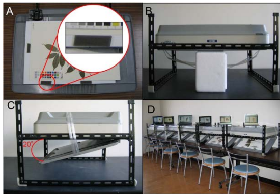
図3. スキャナーを用いた画像撮影装置。スキャナーを逆に設置することで標本が壊れることを防いでいます。