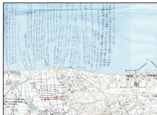
福島第一原発のすぐ近くの浜で採取された植物の採取場所の書かれた地図。標本は福島大学内の標本室に保管されています。