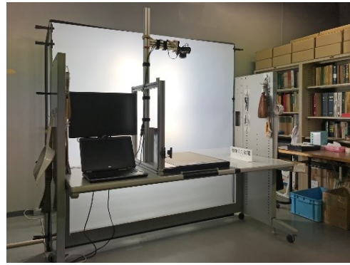
図4. デジタルカメラを用いた画像撮影装置(兵庫県立人と自然の博物館)。