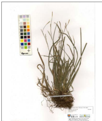
図1. 島根県立三瓶自然館サヒメルに収蔵されている、ダイセンズゲの標本。1995 年に杉村喜則先生(当時島根大学生物資源科学部)によって島根県邑智郡で採取された標本。