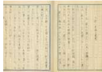
中村元の日記より