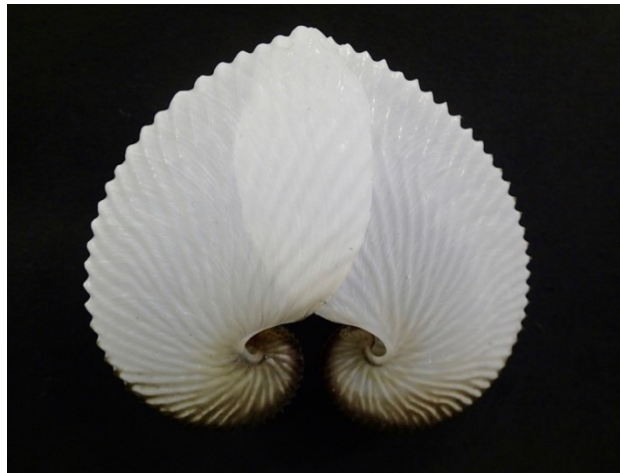
図1 アオイガイの名前の由来になった貝殻（2枚重ねると葵の葉に見えることから）

日本ではアオイガイとタコブネの2種の殻が冬季によく見られますが、カイダコの本体が打ち上がることは稀です。隠岐の島町内の水産会社・吉田水産の協力で、両方の種を採取することができました。アオイガイは夏から秋にかけて比較的多くみられるものの、タコブネはほぼ夏にだけに見られることもわかりました。