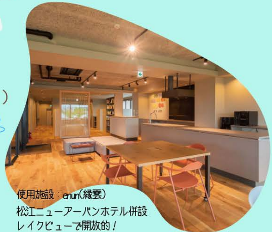
使用施設：enun(縁雲) 松江ニューアーバンホテル併設 レイクビューで開放的！

会場 enun（縁雲） ホテル一体のワーキングスペース https://enun.jp/ 690-0845 島根県松江市西茶町40-1 松江しんじ湖温泉駅より 徒歩7分