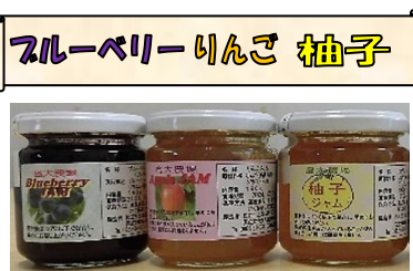
農場で栽培した原料で 作ったジャム