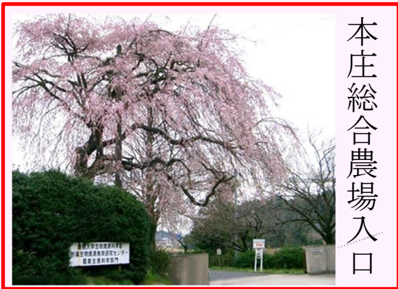
本庄総合農場入口