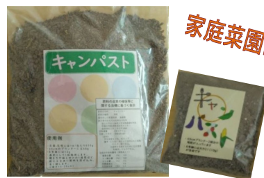
島根大学生協食堂の食品廃棄物から 作った有機質肥料です