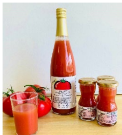
農場で栽培したトマトで作った 無塩のトマトジュース