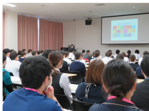
医科研修医・歯科研修医，新任看護師，医療職員研修