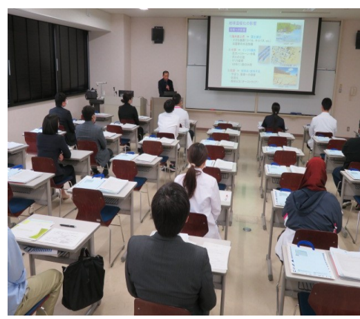
大学院新入生オリエンテーション研修