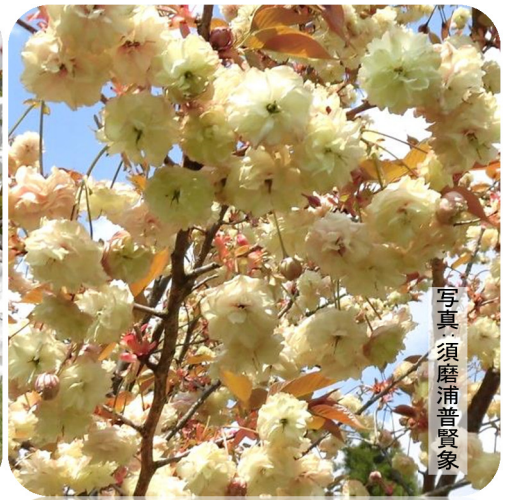
写真 須磨浦普賢象