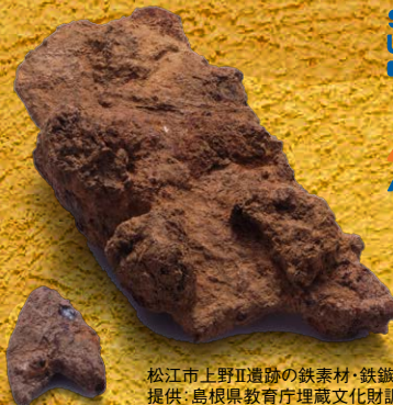
松江市上野II遺跡の鉄素材・鉄鏃