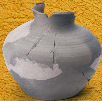
出雲市山持遺跡の楽浪土器