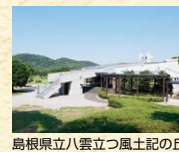
島根県立八雲立つ風土記の丘

《申込方法》 下記の方法のいずれかの方法でお申し込みください。令和2年2月上旬ごろ入場整理券を郵送いたします。