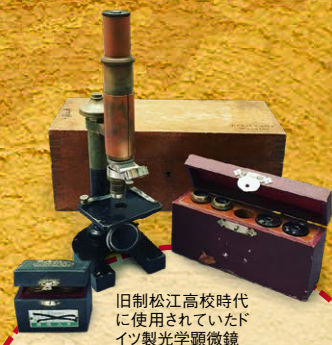
旧制松江高校時代に使用されていたドイツ製光学顕微鏡

第2部では、このような歴史・風土をもつ島根の地において、開学70周年を迎えた島根大学の現在の取り組みをご紹介します、地域や国際社会に貢献していく本学の将来を展望します。