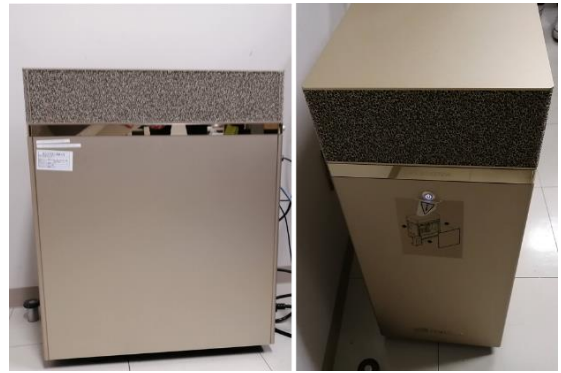
図 10. 57万枚の画像を使って学習を行わせただけに用いた高性能パソコン。島根大学総合理工学部に設置されています。