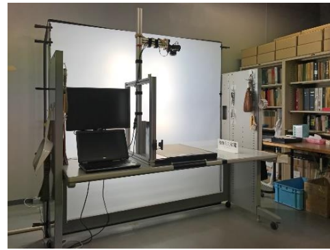
図4. デジタルカメラを用いた画像撮影装置(兵庫県立人と自然の博物館)。