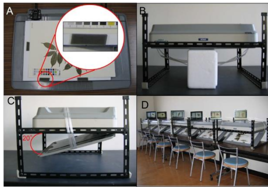
図3. スキャナーを用いた画像撮影装置。スキャナーを逆に設置することで標本が壊れることを防いでいます。