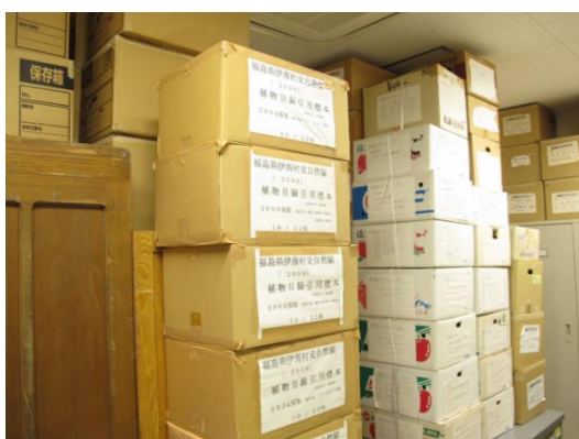
福島第一原発事故により避難した方が所有していた植物標本。現在は、福島大学内の標本室に保管されている。これらもスキャンして画像解析に使用しました。

近年になり画像認識技術が発展し、AI によって人物を特定することなどが可能になっています。AI ならば植物の種名を正しく判定することもできるかもしれないと考えたのが、本研究の背景です。最近では、携帯のカメラで撮影した植物の写真から種名を判定してくれるアプリもたくさん作成されています。これらは身近な植物、特に花を撮影すると高い確率で正解を教えてください。一方で、葉だけや茎だけでは判定は難しく、また珍しい植物は判定できません。我々は国内で採集された約57万点の植物標本の画像を使って、種名を判定するシステムを構築しました。このシステムを用いることで、誤同定された標本を選び出すことも可能になりました。