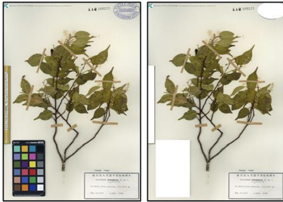
図 9. 鹿児島大学の標本画像には竹の規格が写っています。これを AI は植物だと判断することがありました。そこで、規格、カラーバー、スタンプなどを画像処理によって除去しました。