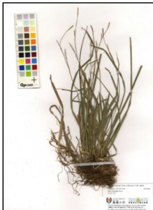
図1. 島根県立三瓶自然館サヒメルに収蔵されている、ダイセンスゲの標本。1995 年に杉村喜則先生(当時島根大学生物資源科学部)によって島根県邑智郡で採取された標本。