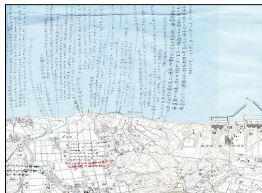
福島第一原発のすぐ近くの浜で採取された植物の採取場所の書かれた地図。標本は福島大学内の標本室に保管されています。