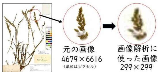
図 7. 学習に用いた画像は 299×299ピクセルであり、もとの画像とくらべると粗いです。

このような画像を用いても AI は種の判定を行うことができました。一方で人間は細かい部位の形態を時には虫眼鏡を使って観察し種を判定することもあります。