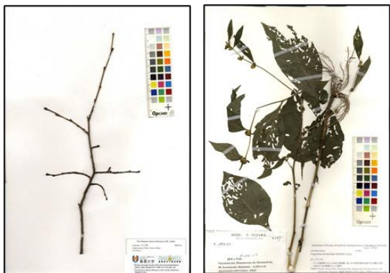
図 5. 標本の中には葉が取れてしまっていないものや、葉に虫食いの穴が沢山空いているものがあります。このような標本約 3 万点を学習対象から外すことで判定成功率が上昇しました。

57万枚の標本画像を収集し、それらを AI 画像認識システムを用いて学習させ、種名を判定するシステムを構築しました。対象となるのは約 2000 種であり、96.4%と極めて高い判定精度で正しい種名を選び出すことができます。こういった標本画像が判定に向かないか(図 5)、専門家がよく間違える種を AI も同じく間違えている事などもわかりました(図 6)。学習に用いた画像ファイルの解像度は低く、細かい部位までは見えませんが、AI は正しく判定できていることがわかりました(図 7)。AI が判定に使った部位を可視化することができる Grad-CAM 解析を行ったところ、人間が判定に使っている部分を AI も使っていることがわかりましたが、種によっては人間が判定には使わない部分を使って判定していることもわかりました(図 8)。鹿児島大学の標本画像の中には竹の定規が写っていますが、これを植物(竹)として認識してしまうこともわかりました(図 9)。学習には高性能のパソコンが必要ですが、島根大学総合理工学部に設置されているパソコンを使うことで、約1週間で解析が終わりました(図 10)。作成した植物の種名の判定システムは http://tayousei.life.shimane-u.ac.jp/ai/index_all.php にて公開しています(図 11)。